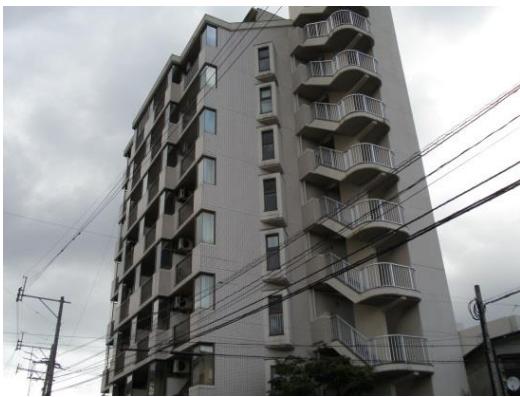
リタイアを決定づけた高利回り RC 物件