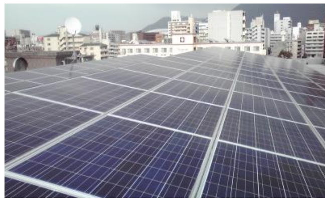
節税に絶大な威力を発揮する太陽光発電