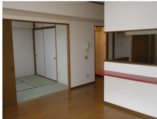
法人所有の高利回り RC ファミリー物件（外観と部屋）