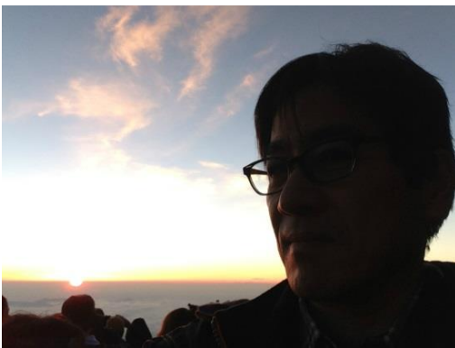
富士山山頂からのご来光