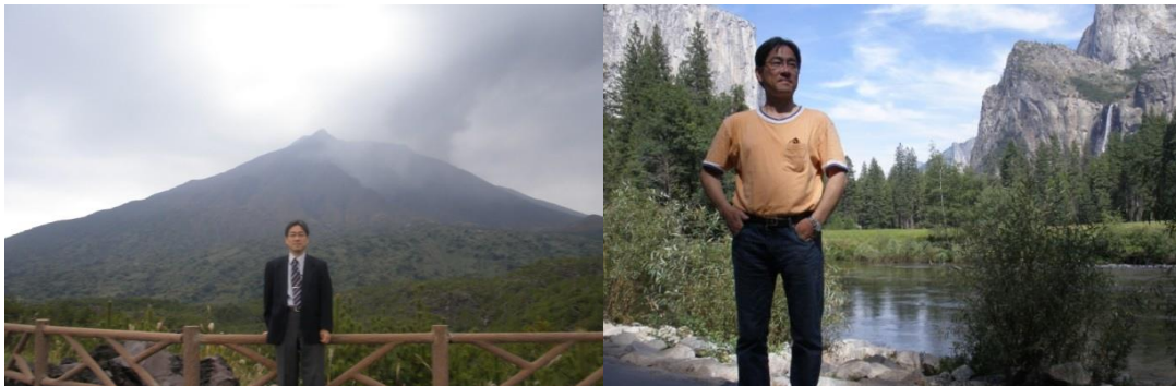
昨年、日本はもちろんのこと、米国サンフランシスコへ1週間の旅をした時の写真 (バイエリアの高級住宅街、サンフランシスコ市内中心地のマンション内覧など)

不動産は、管理や運営などの手間こそ存在しますが、 忙しいサラリーマンの傍ら5年の副業で2.2億円もの資産を築き、 キャッシュフローが年収7千万円という莫大な資産を築けるほど、時間にゆとりがあるのです。